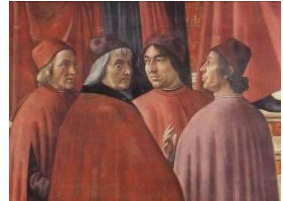
ARTISTI E LETTERATI OSPITATI A CORTE