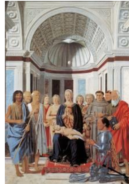
Piero della Francesca, Pala Montefeltro , 1466-72 ca.

Opera commissionata da Federico da Montefeltro