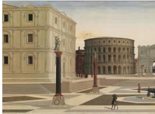
RINNOVAMENTO DELLE CITTÀ