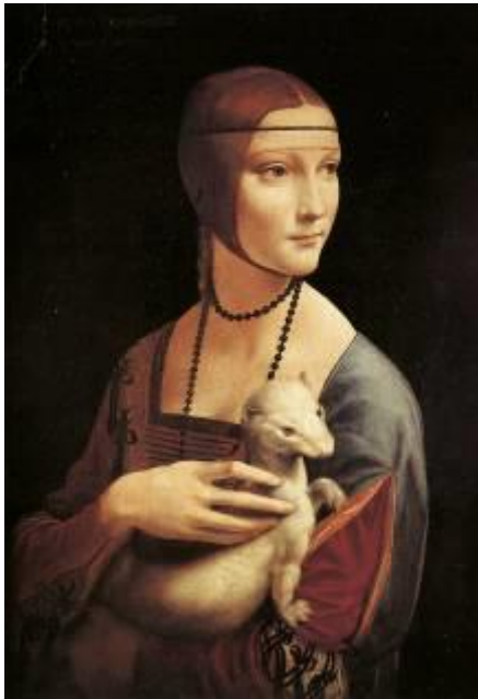
Leonardo Da Vinci, Dama con l'ermellino , 1485-90

I signori chiamano presso le corti letterati e artisti, li sostengono e li proteggono e commissionano loro la realizzazione di opere d'arte , secondo le nuove tecniche compositive (prospettiva)